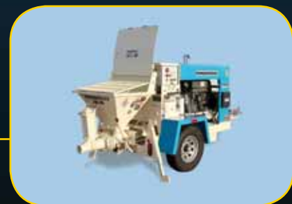
Serie TK Bombas hidráulicas de válvula de bola

Disponible en versiones diesel o eléctricas montadas en patines. Comuníquese con la fábrica.