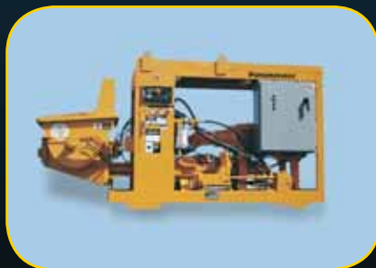
Serie TKS • Montada en patines

Disponible en versiones diesel o eléctricas montadas en patines. Comuníquese con la fábrica.