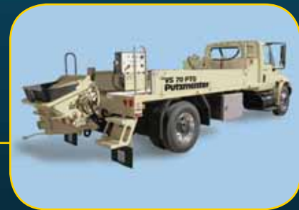
Serie VS • Montada en vehículo Consulte la hoja de especificaciones que está aparte.