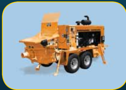
Serie BSA 100